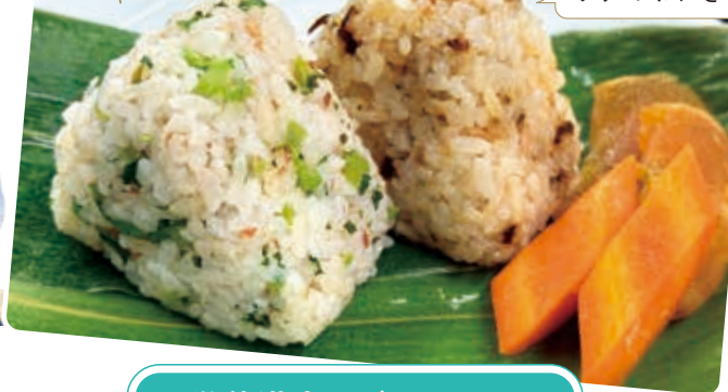
塩昆布とツナのおにぎり

手軽に食べられるおにぎりでお米をたくさん食べよう! 令和8年2月号まで、各地区の女性部員が考案した おにぎりレシピを掲載していきます。