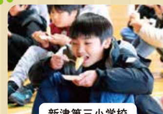
新津第三小学校 ル レクチェ出前授業