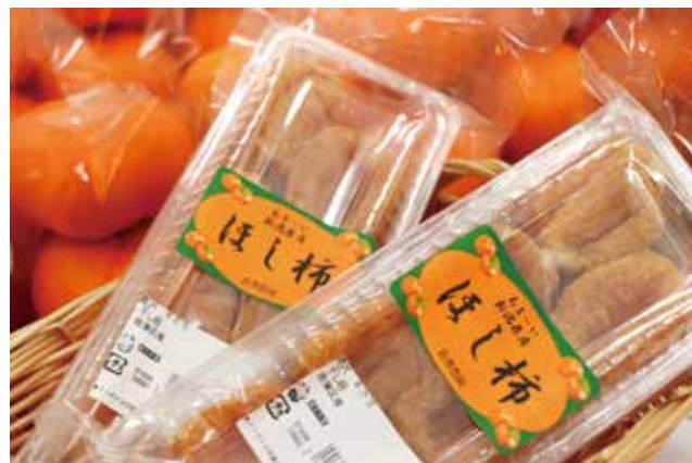
越王の里で販売している干し柿

直売所「越王の里」では、5人の地元生産者が手間ひまかけて作る干し柿が好評販売中です。規格外の柿を有効活用し、伝統的な製法やさまざまな工夫を重ねて仕上げた干し柿は、柔らかさと鮮やかな色が特長。そのままはもちろん、ヨーグルトやクリームチーズと合わせたり、生ハムを巻いておつまみにしたりと、アレンジも楽しめます。販売は2月下旬までです。