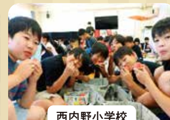
西内野小学校 スイカ出前授業