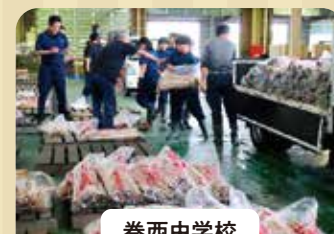
巻西中学校 ゴボウ収穫・角田園芸 センターで荷下ろし