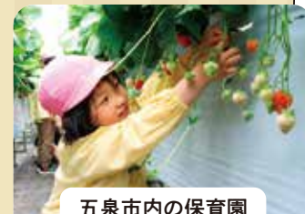
五泉市内の保育園 「越後姫」収穫