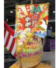
JA新潟かがやきの宝船 (新潟市中央卸売市場)