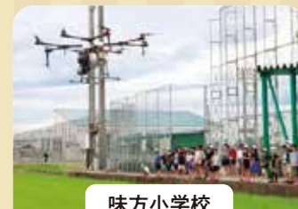
味方小学校 ドローン散布見学