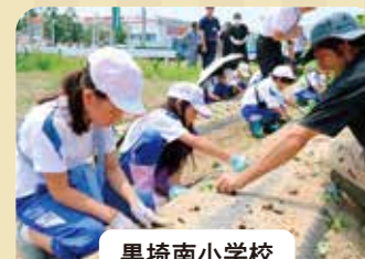
黒崎南小学校 枝豆定植