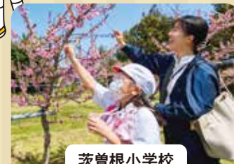
茨曽根小学校 桃の花粉付け

JA新潟かがやきでは様々な食農教育を行っています! 本特集では令和7年度の活動の一部を写真で紹介いたします。