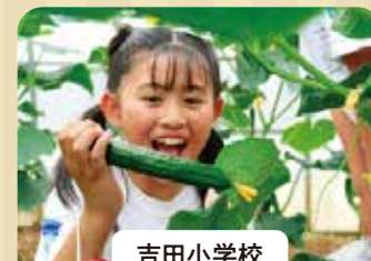
吉田小学校 「もともちきゅうり」 ハウス見学