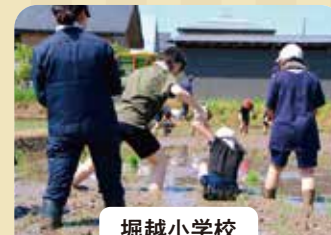
堀越小学校 田植え