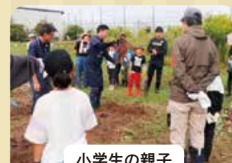
小学生の親子 親子あぐりスクールで サツマイモ収穫