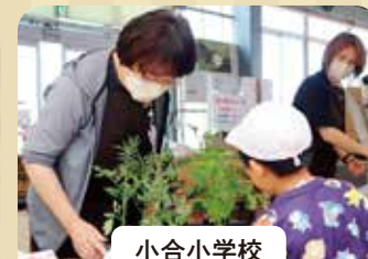
小合小学校 花夢里にいつでも 野菜苗購入