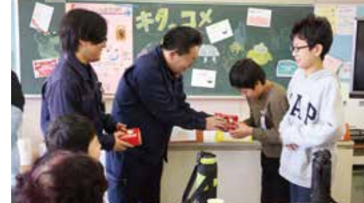
児童にふりかけセットを手渡すJA職員