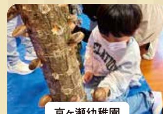
京ヶ瀬幼稚園 原木しいたけ収穫