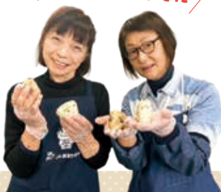
おかか梅干しと大根菜のおにぎり