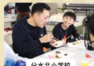
分水北小学校 収穫を祝う感謝の会