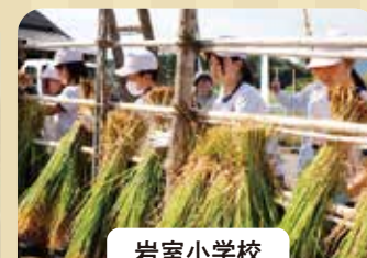
岩室小学校 はざかけ