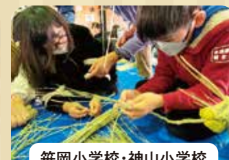
笹岡小学校・神山小学校 しめ飾り製作