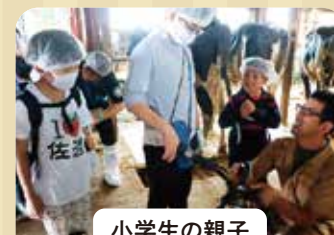
小学生の親子 親子わくわく☆ モ〜モ〜スクール