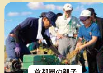
首都圏の親子 パルシステム 稲刈りツアー