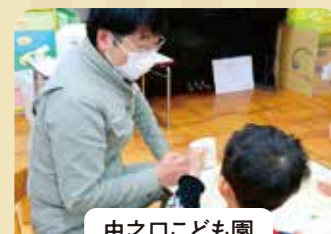
中之口こども園 シャカシャカおにぎり